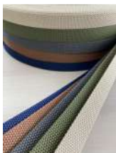
▲合皮・両面テープ・平ゴム