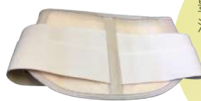
▲足底板サポーター

豊富なネットワークを活かしコルセットなどの難しい縫製品も製作可能。制作のご依頼も承ります。