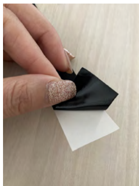
▲高耐水粘着で水に強くはがれにくい！