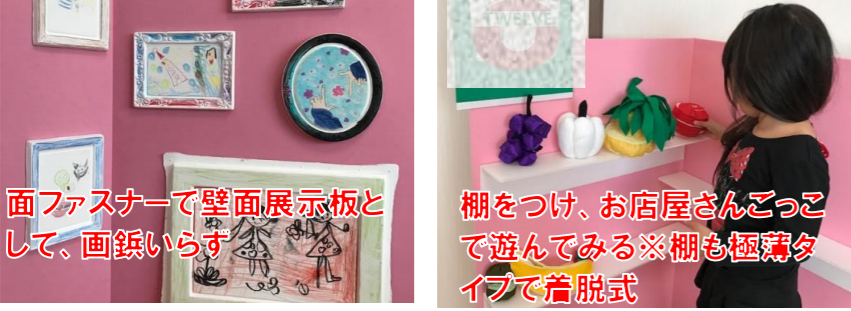
面ファスナーで壁面展示板として、画鋸いらす