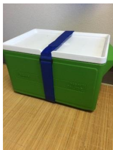
キャンプ用品にも活躍！

面ファスナーを使用している事で繰り返し使用が出来、着脱も簡単でフレキシブルに扱える。イベント業界、アウトドア関係、産業用途、梱包関係……etc 様々な業界で活躍を約束。プリント、バイカラー使用、薄型、タグ付き、平かん付き、平かん無し、伸びるタイプなどメーカーだから出来るオーダーメイド製造も魅力的なポイント。