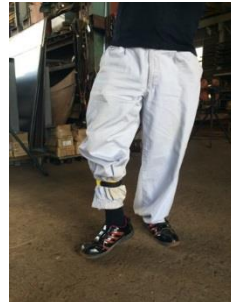
伸びるタイプで裾止バンドにも！