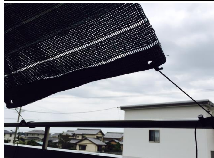
(上写真) 静岡県浜松市 某アラコー社員宅 紐と面ファスナーとコードストッパーが三位一体のコラボレーションを見せた「とめるくん」。主にベランダなどの日よけシェードの固定役として活躍している。

2016年夏、アラコーのお家芸でもある面ファスナーがまた、新たな境地へと一步を踏み出した。熱い夏の陽射しを遮る遮光カーテン。近年ではあらゆる家庭の軒先で目にすることが出来る。設置の経験がある人も多いのではなかろうか。こういったシートには、一般的にハトメが取り付けられてあり、紐で縛ることが殆どである。しかし、紐で縛るとなると、左右のテンション調整が面倒であったり、強く結ぶと解きたい時になかなか解けなかったりすることが多々ある。そんなかゆみを解消するのが、今回紹介する弊社お客様とのコラボ商品「とめるくん」だ。